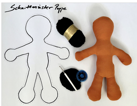
Foto: Schnittmuster Puppe

Anstelle von flexibel nutzbaren Videoangeboten funktionieren feste gemeinsame Termine und klare Strukturen gut, um Projekte wie die Puppenwerkstatt im Team umzusetzen. So kriegen die Fachkräfte das Gefühl, etwas gemeinsam zu machen und können sich über ihren Alltag austauschen und vernetzen.